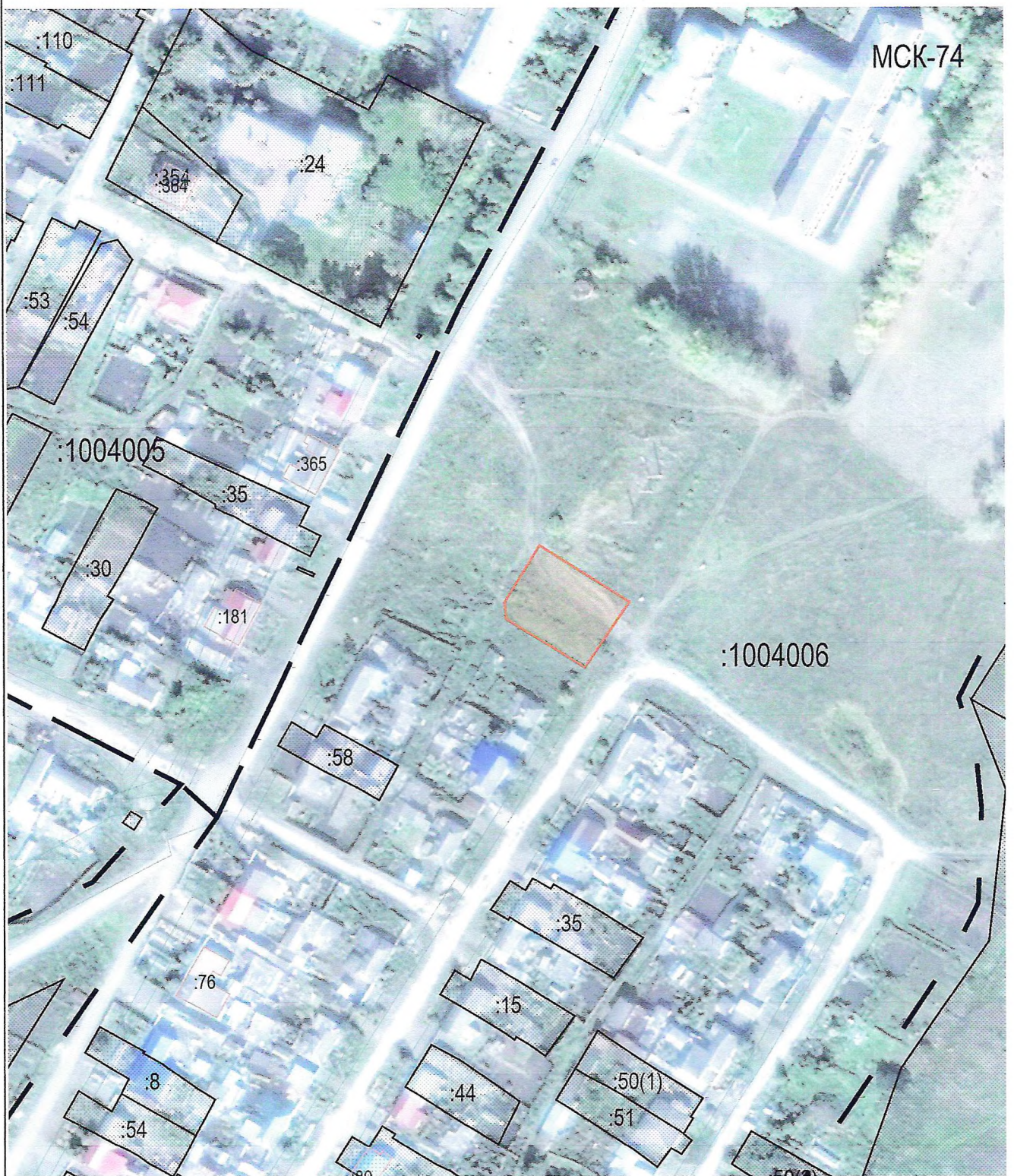
Масштаб 1:2 000